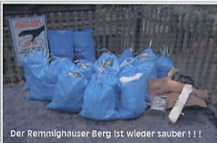
Der Remmighauser Berg ist wieder sauber !!!